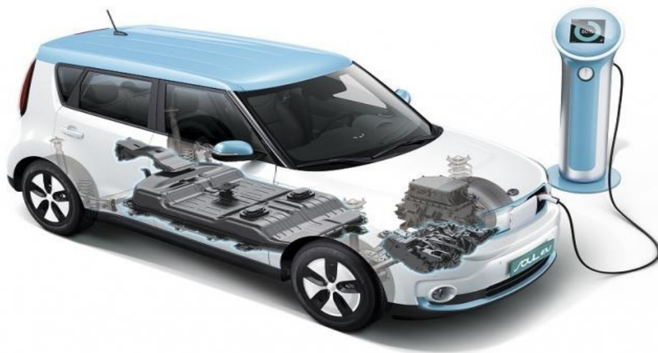
2.ábra 2 : Elektromos jármű akkumulátorának elhelyezkedése

Tűzvédelmi szempontból meglehetősen nagy kihívást jelent, hogy ezek az akkumulátorok „oxigén nélkül” is tudnak égni. Természetesen ez nem azt jelenti, hogy az égési folyamatnak nincs szüksége oxigénre, hanem azt, hogy az égéshez szükséges oxigén megfelelő mennyiségben keletkezik az anód és a katód bomlásából adódóan, tehát a környezetből történő oxigén elvonás nélkül is képesek égni. [17]