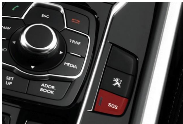
3.ábra 3 : Az e-Call rendszer segélykérő nyomógombja egy elektromos Peugeot iOn-ban

többre. Az életveszély elhárítása közben a mentett személyben keletkező további sérülésekért a mentő személy nem tartozik felelősséggel, mivel ilyenkor az életveszélyes helyzetből való mentés a legfontosabb. Egyes újabb típusú autókba már beépítésre került segélyhívó rendszer, mely baleset esetén gombnyomásra vagy automatikusan segítséget hív, elküldi az aktuális tartózkodási helyet a mentőszervek felé. Az “e-Call” nevű rendszer a tartózkodási hely mellett a járműben bekapcsolt övek számát, valamint a jármű üzemanyagát is továbbítja a Magyar Autóklub operátorainak, akik értesítik a illetékes mentőegységeket. Az adatok a tűzoltóknak és mentőknek egyaránt nagy segítséget jelent, így meghatározható a kivonuló mentőkocsik száma és a beavatkozó tűzoltó jármű típusa és felszereltsége. Éppen ezért, a halálos kimenetelű autóbalesetek elkerülése végett, 2018 április 1. -jétől egy Uniós rendelet értelmében csak olyan új jármű bocsátható forgalomba, amely rendelkezik ezzel a fedélzeti egységgel. [21] [22] [23]