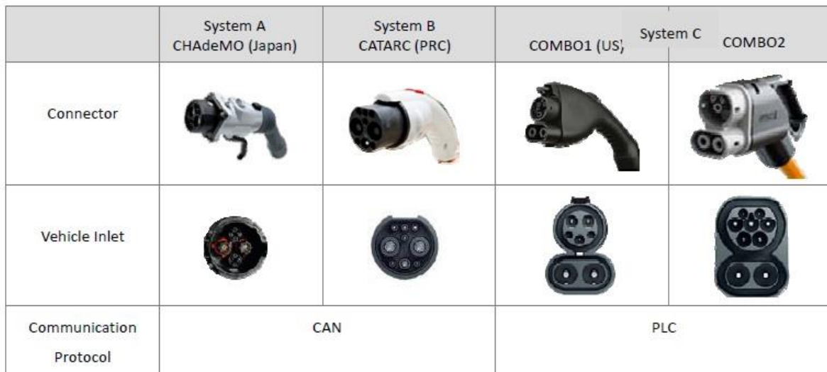
9.ábra 10 : Villámtöltők típusai

Az úgynevezett villámtöltők melyek DC 50 kW egyenáramú teljesítménye a leggyakoribb és átlagosan 20-30 percet vesz igénybe. Ám ez a típus előreláthatóan 150 kW teljesítményűre cserélődik, valamint bevezetésre kerül a CHAdeMO egységes csatlakozó típus, amellyel mind az általános/normál töltés, mind pedig a villámtöltés lehetségessé válik. Ezekon kívül még az ismertebb csatlakozók közé tartozik a COMBO1 és COMBO2 illetve a MOD3 és MOD4 típusú villámcsatlakozók. A villámtöltés a közhiedelemmel ellentétben az akkumulátort nem károsítja mivel a folyamat egyenárammal, megfelelő feszültséggel és áramerősséggel, számítógépek által vezérelve történik. [45]