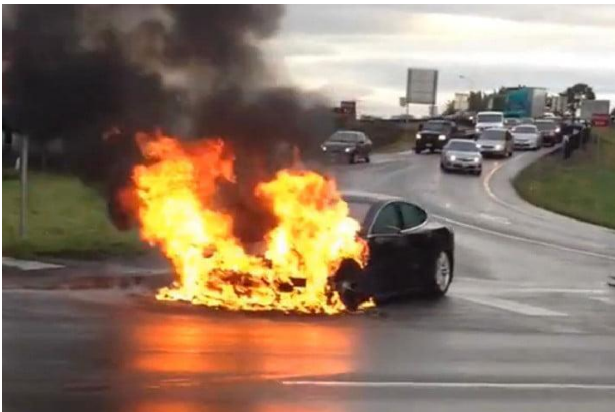
3.ábra 5 : Az égő Tesla Model S

Az NHTSA (National Highway Traffic Safety Administration), vagyis az USA közlekedésbiztonsági hatóságának vizsgálatai után, az a hivatalos álláspont alakult ki, hogy a tűz nem az autó meghibásodásából adódóan alakult ki, hanem a külső behatás okozta, további vizsgálatokat tehát nem tartottak szükségesnek.