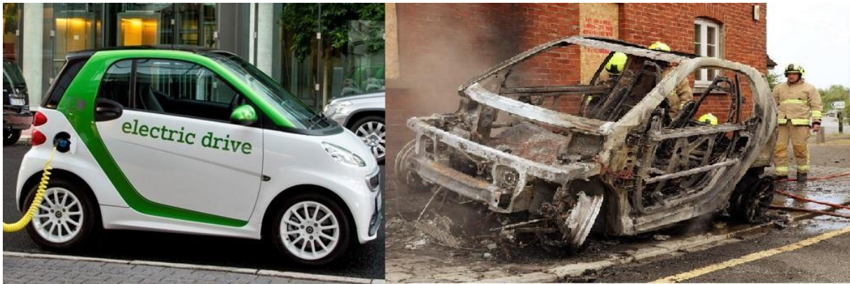
4.ábra 6 : A gépjármű a tűz előtt és utána

Ezen megállapítás véleményünk szerint helytálló, ugyanis minden műszaki cikk esetében a gyártó felelőssége, hogy terméke ne okozhasson balesetet, ennek megfelelően tehát egy akkumulátornak el kell tudnia viselni az efféle megterhelést. Természetesen a felhasználó érdeke is, hogy az ajánlásokat betartsa, azonban előfordulhatnak olyan esetek, amikor a tulajdonoson kívül álló okokból a töltést nem sikerül megszakítani, így egyértelműen a gyártó feladata az ilyen és ehhez hasonló esetek megakadályozása. [20] [33]