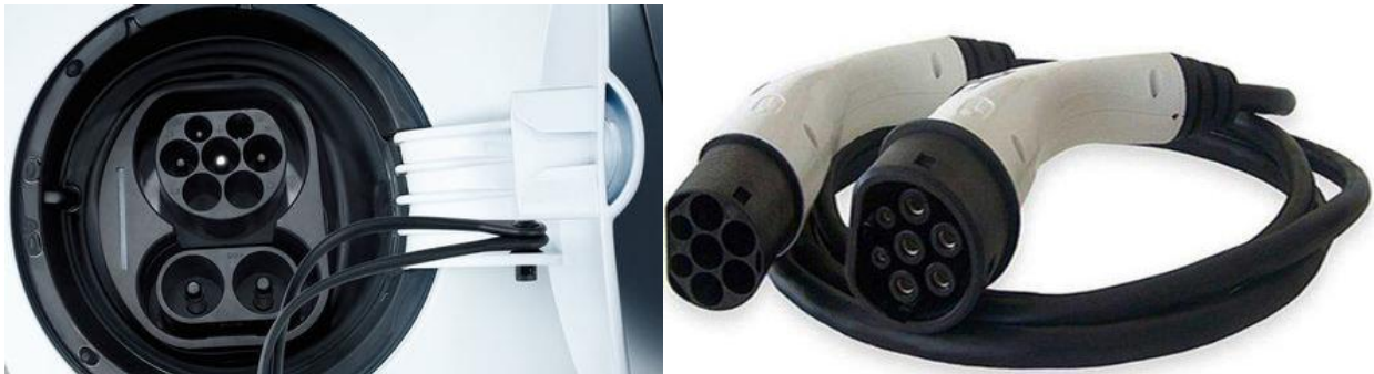
8.ábra 8 : Volkswagen e-UP töltője, 9.ábra 9 : TYPE2 töltőkábel

Az úgynevezett villámtöltők melyek DC 50 kW egyenáramú teljesítménye a leggyakoribb és átlagosan 20-30 percet vesz igénybe. Ám ez a típus előreláthatóan 150 kW teljesítményűre cserélődik, valamint bevezetésre kerül a CHAdeMO egységes csatlakozó típus, amellyel mind az általános/normál töltés, mind pedig a villámtöltés lehetségessé válik. Ezekon kívül még az ismertebb csatlakozók közé tartozik a COMBO1 és COMBO2 illetve a MOD3 és MOD4 típusú villámcsatlakozók. A villámtöltés a közhiedelemmel ellentétben az akkumulátort nem károsítja mivel a folyamat egyenárammal, megfelelő feszültséggel és áramerősséggel, számítógépek által vezérelve történik. [45]