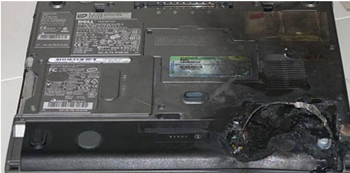
2.ábra 4 : A balesetben érintett repülőgép akkumulátora

Öt incidens történt a Dreamliner gépekkel kapcsolatban, melyek közül az egyik esetben kényszerleszállást kellett végrehajtani Japánban a Takamatsu repülőtéren és a repülőgép azonnali kiürítése vált szükségessé. Egy másik esetben egy Japánból Bostonba tartó járaton a landolást követően tűz ütött ki, valószínűleg rövidzárlat eredménye képpen. Ekkor azonban már senki nem tartózkodott a gépen. Komolyabb személyi sérülés egyik esetben sem történt, mivel a meghibásodást szerencsés módon, időben észlelték. Azonban a szakemberek felismerték ezen hibáknak a jelentőségét és tisztában voltak azzal, hogy javítás nélkül az akkumulátorok előbb-utóbb komoly balesetet fognak okozni.